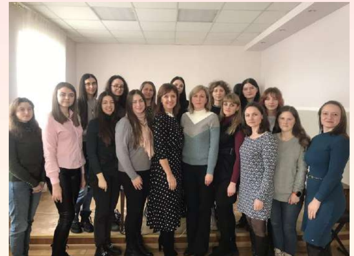
Школа початкуючого психолога