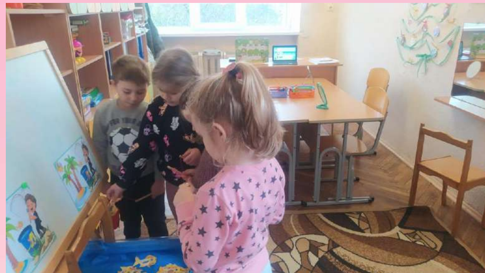
«Інтерактивні логопедичні ігри»