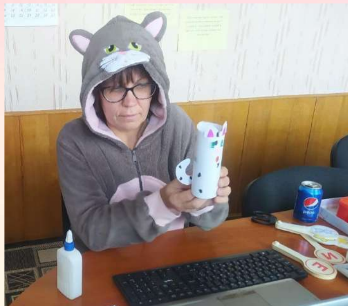
Клуб вихователя-початківця «Компетентнісні кроки до професії»